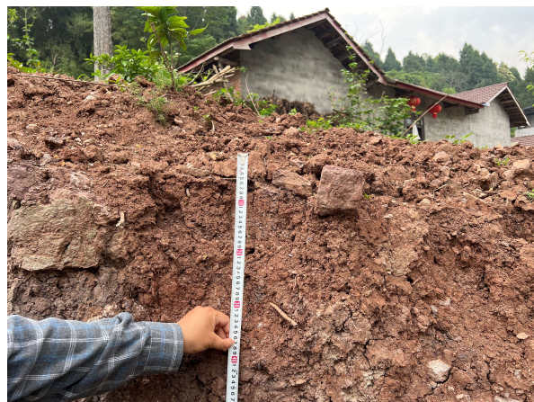
图 2.4-2 耕地表土厚度调查情况