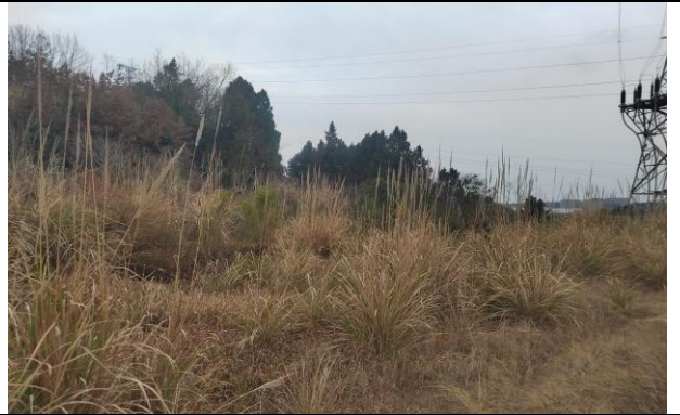
(4) 架空线路沿线地被物 1