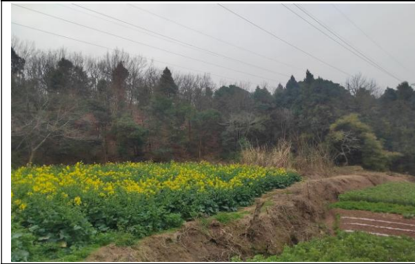
(3) 架空线路沿线地被物 1