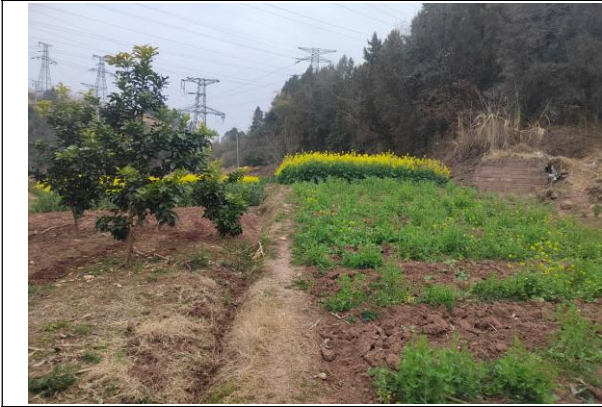
(1) 棉丰变侧拟建电缆沟通道现状 1