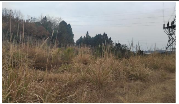
(6) N6 号铁塔侧拟建电缆沟通道现状 2