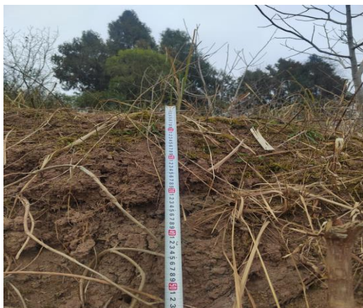
图 2.4-1 林地表土厚度调查情况