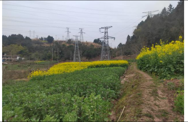
(2) 棉丰变侧拟建电缆沟通道现状 2