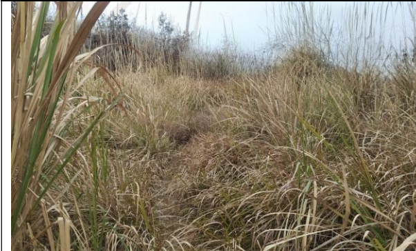
(5) N6 号铁塔侧拟建电缆沟通道现状 1