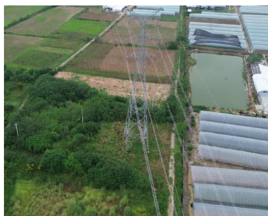
NA10塔位现状（植被恢复状况良好）