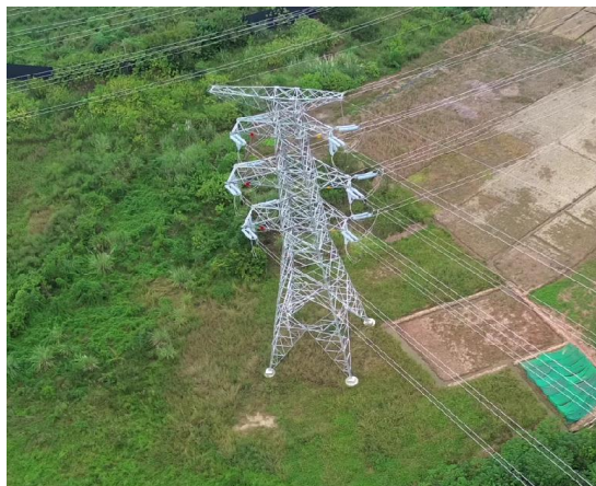
NB2塔位现状（植被恢复状况良好）