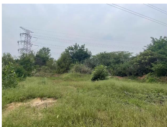
NB5、NC5塔位旁施工临时占地植被正逐步恢复