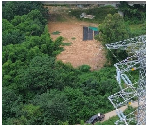
NA25处牵张场植被覆盖率暂不达标