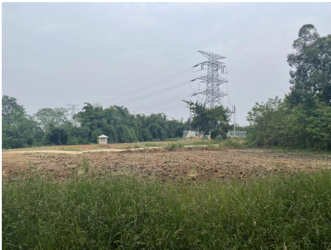
NA25塔位已重新进行土地整治、植被正逐步恢复