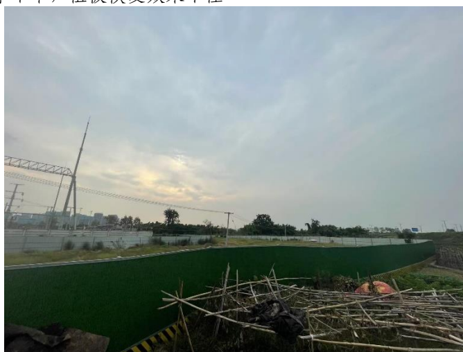
NC6塔位及电缆通道施工围栏尚未拆除、场地尚未恢复为耕地