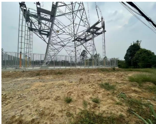
NB5、NC5塔位围栏施工活动结束后已进行土地整治，但由于干旱，植被恢复效果不佳