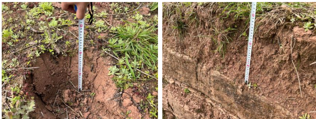
项目区表土厚度调查照片