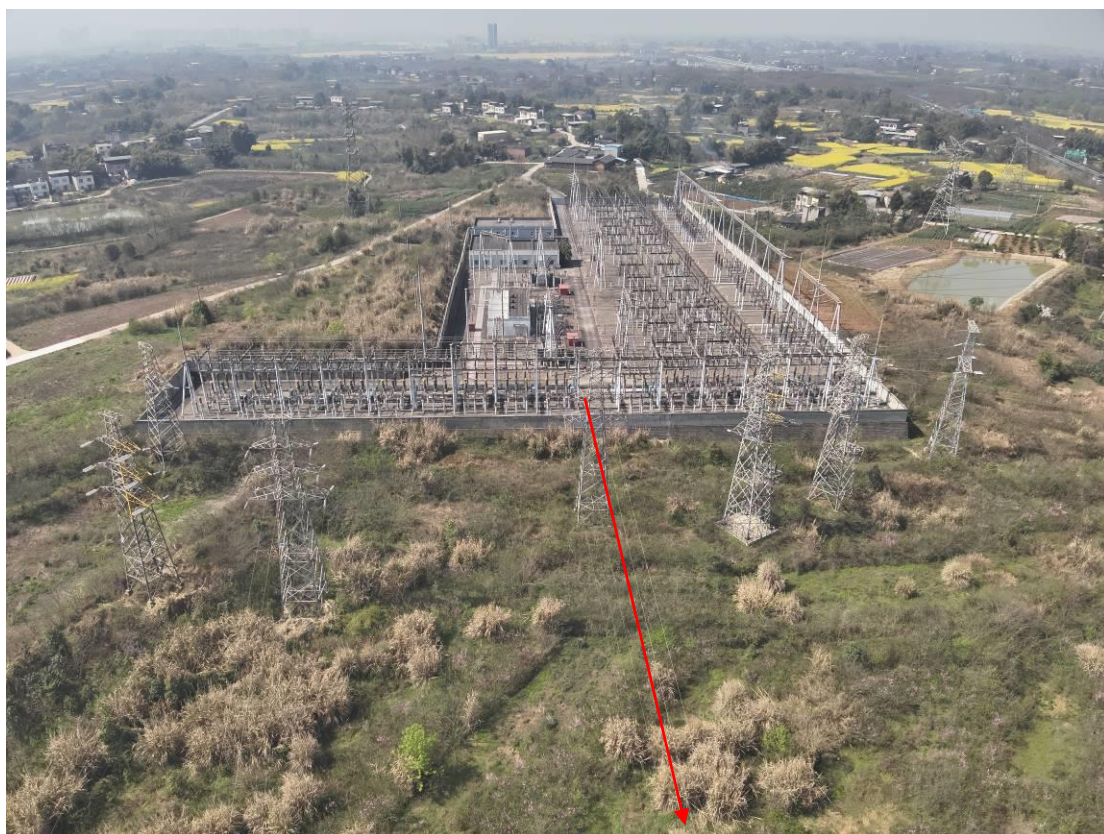
云绣 220kV 变电站出线