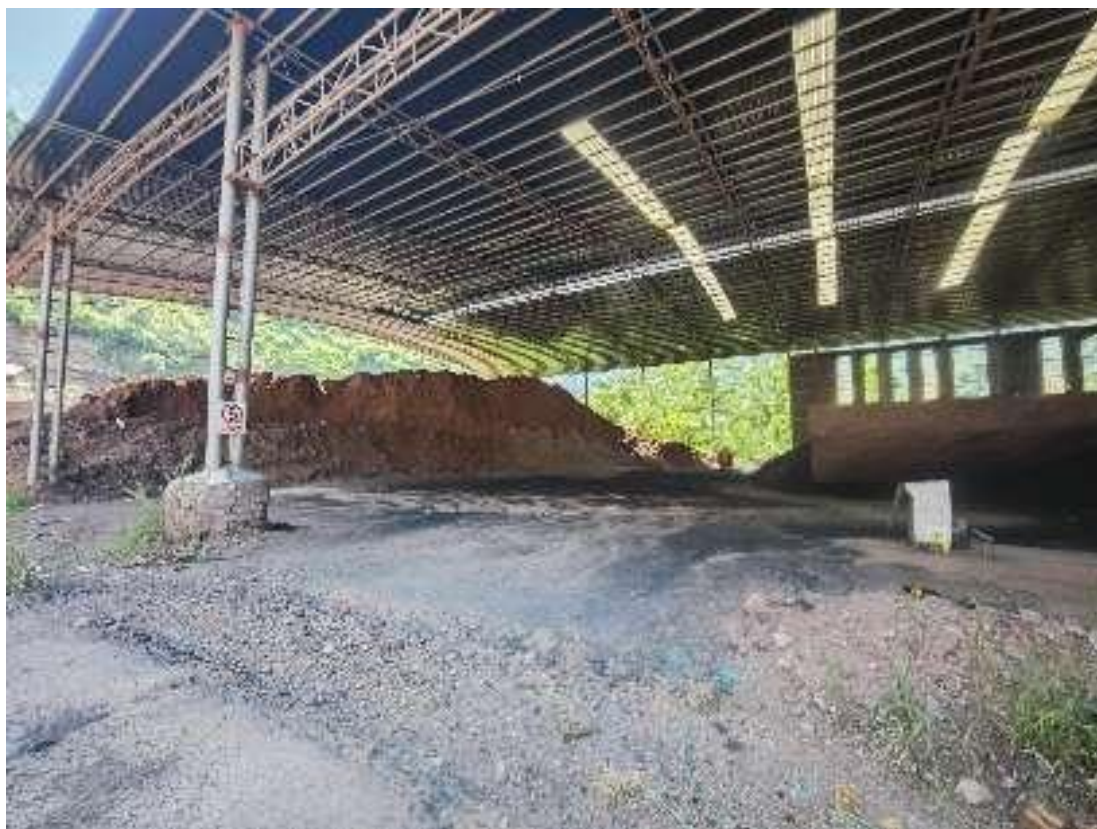
金堂县淮口团结页岩砖厂余土堆放地现状

综上所述，本项目弃方运至金堂县淮口团结页岩砖厂综合利用可行，符合水土保持的要求。