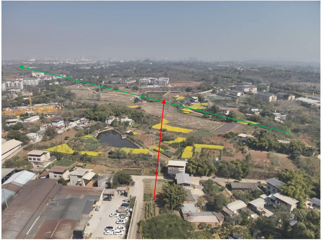
利用原线路接入区域