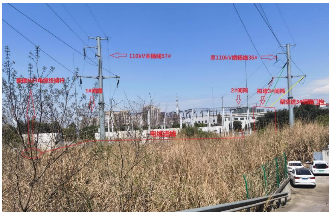
电缆区域用地现状

本项目新建电缆沟 70m，余缆井 1 座。电缆沟净空断面 0.8\text{m} \times 1.05\text{m} ，两侧壁厚 0.25m，底部厚 0.3m，底部铺 100mmC15 混凝土垫层，外部尺寸 1.55\text{m} \times 1.3\text{m} ，混凝土等级 C25，防渗等级 P8。余缆井净尺寸：长 3.5\text{m} \times 宽 3.5\text{m} \times 高 2.0\text{m} 。