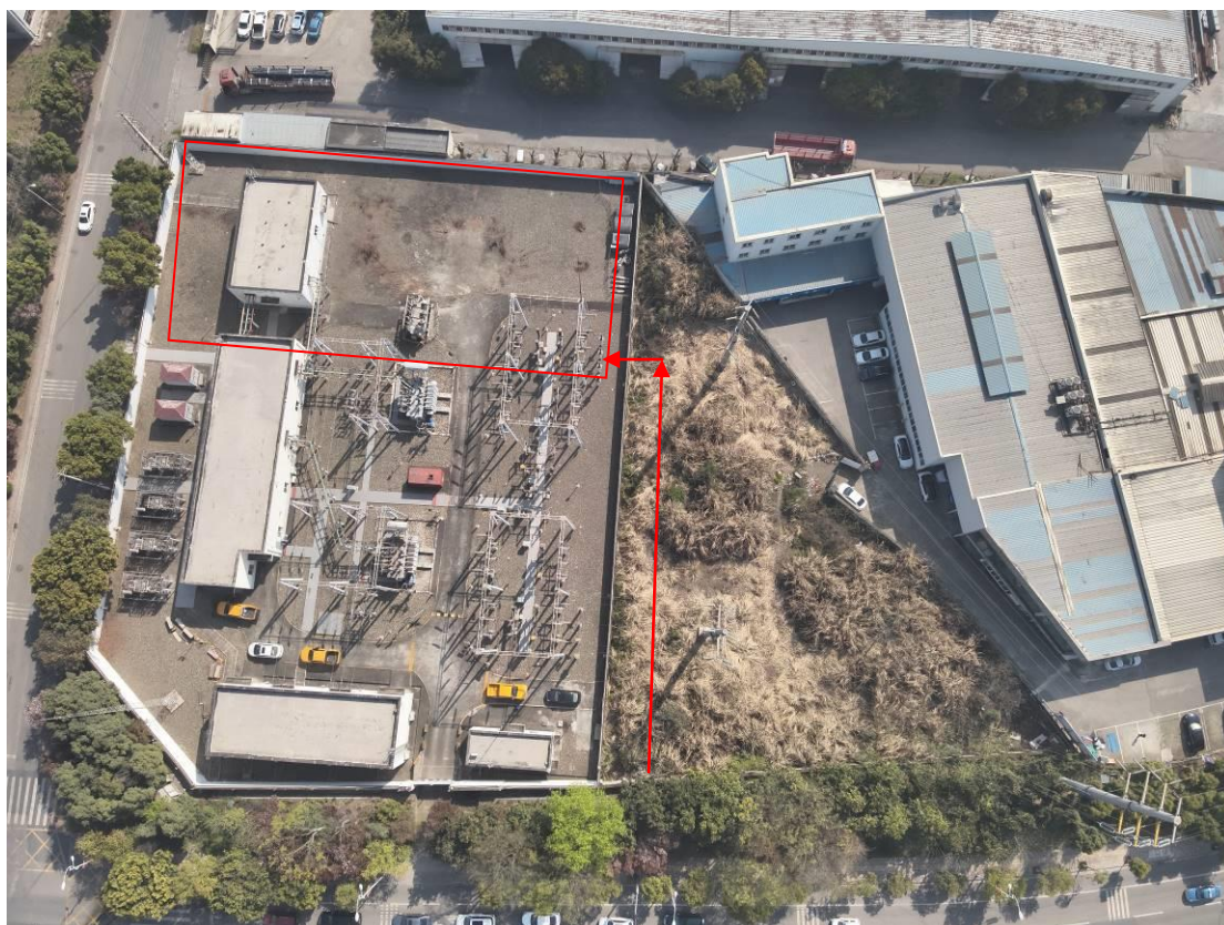
杨柳 110kV 变电站扩建区域及电缆走线