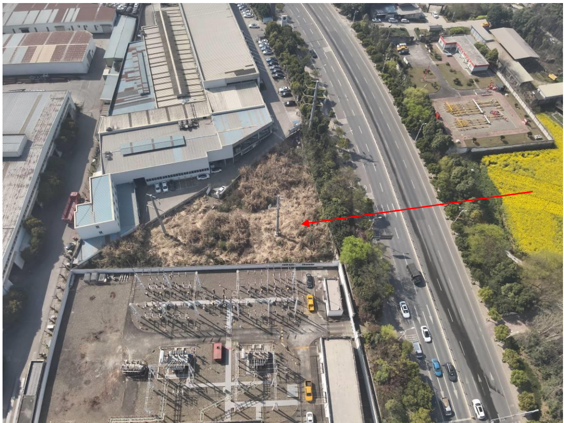
杨柳站外跨越成环路