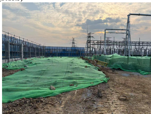
变电站扩建区密目网遮盖