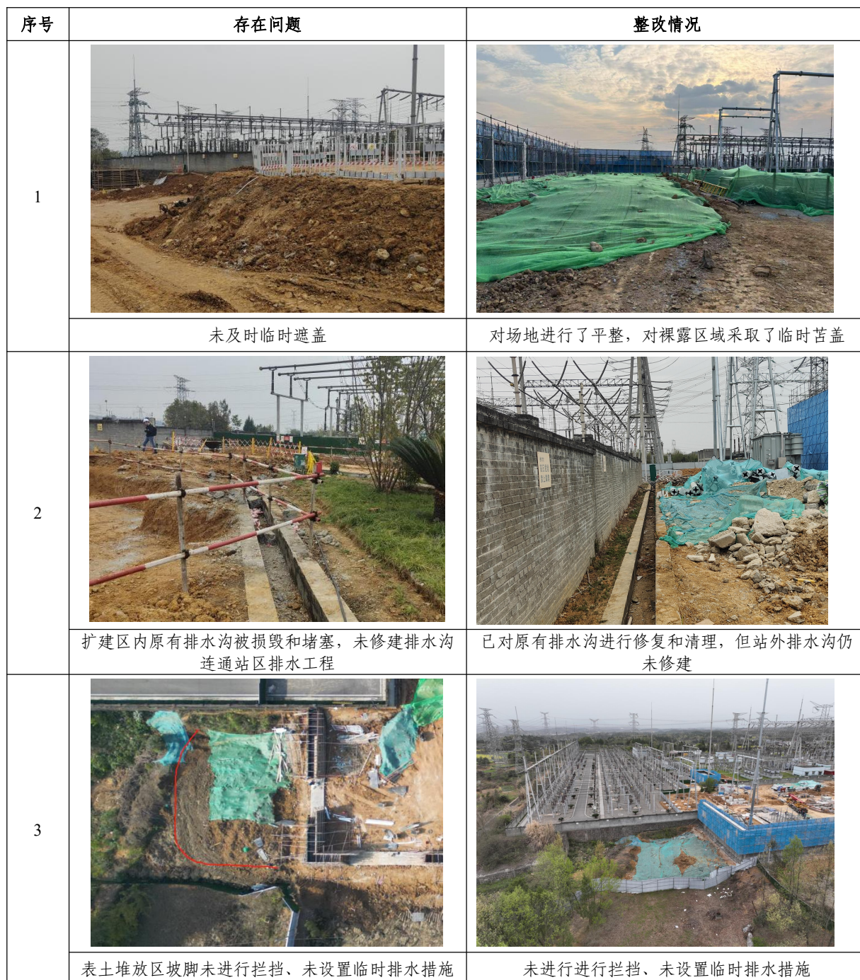
表 5.2-1 2024 年第 4 季度水土保持监测问题整改台账

业主项目部和施工单位针对 2024 年第 4 季度现场问题进行了部分整改,但是部分问题仍整改不完善。