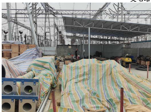
变电站扩建区防雨布遮盖