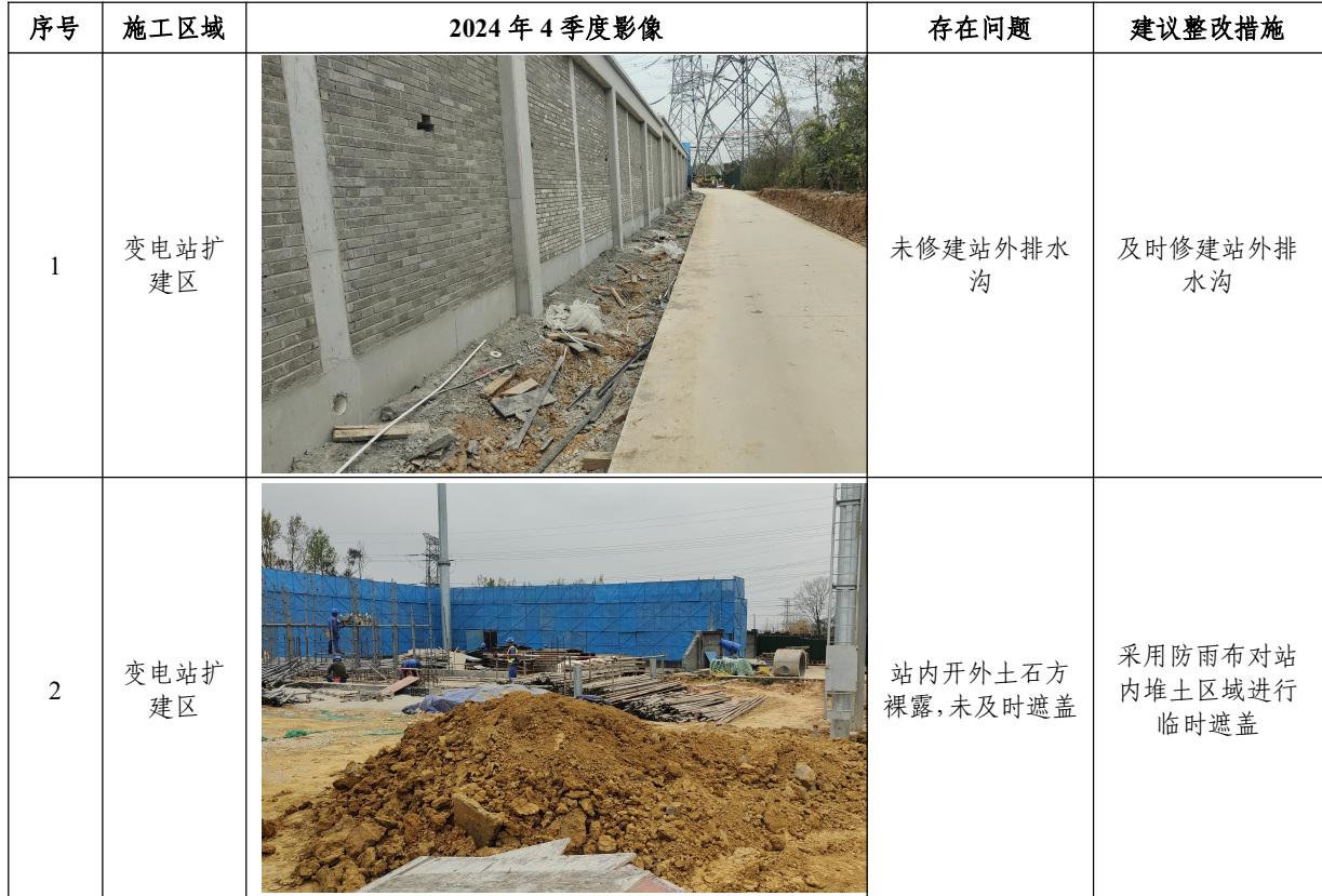
表 5.1-1 本季度水土保持问题及建议