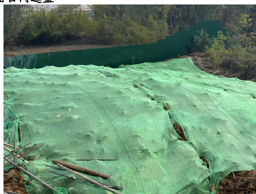
表土堆放区密目网遮盖