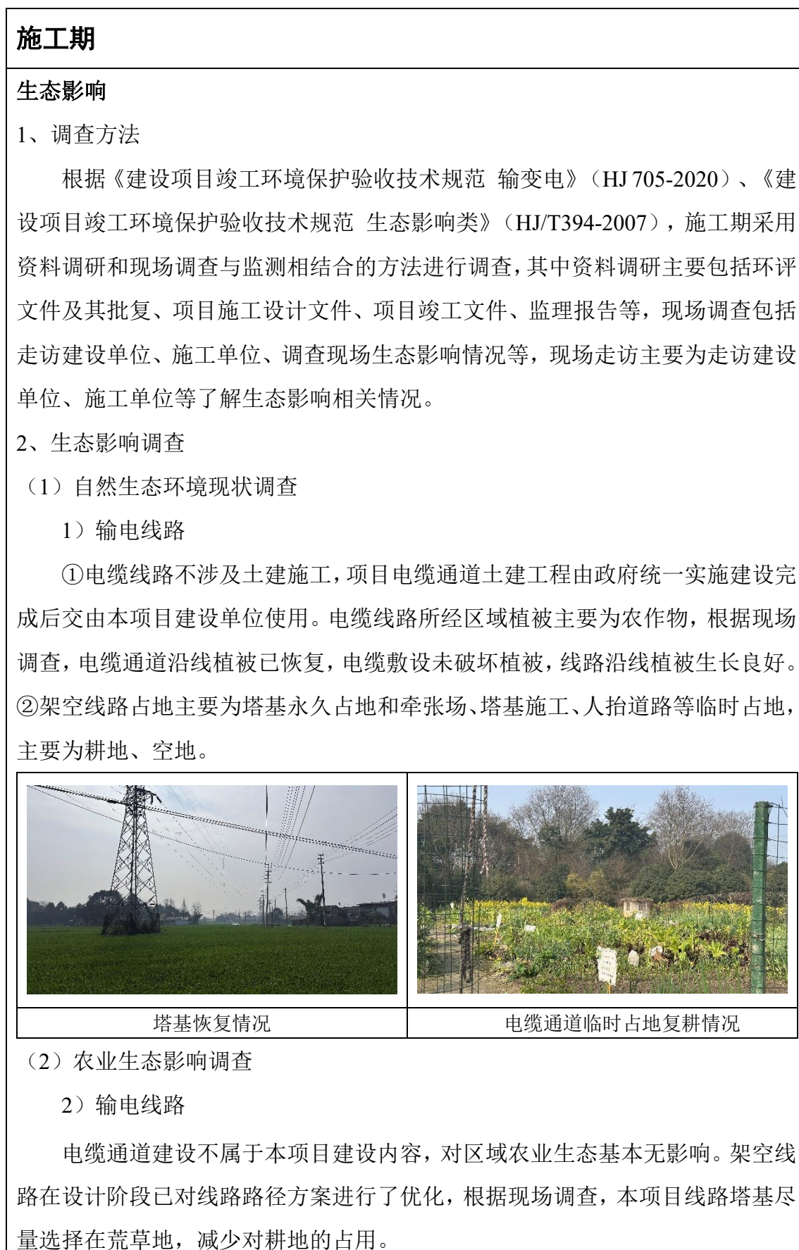
表 8 环境影响调查