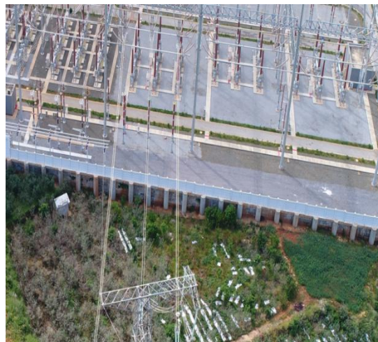
东侧融冰开关区域现状