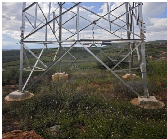
新建塔基区域现状