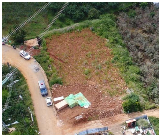
施工场地区域土地整治