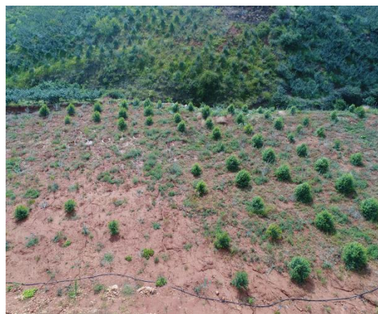
取土场内植被恢复