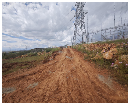
施工道路区域现状