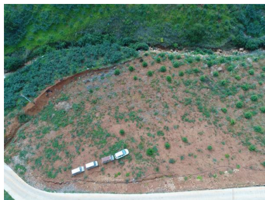
取土场内植被恢复