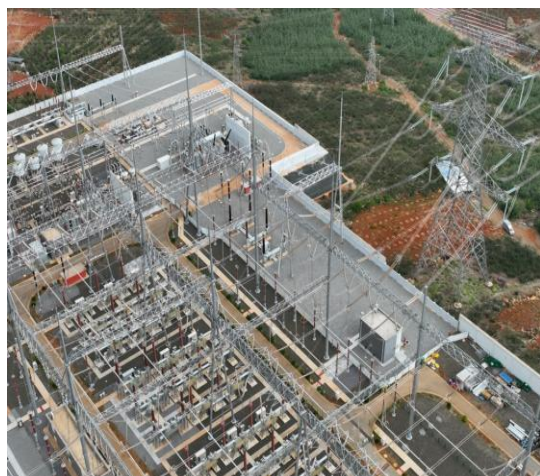
站外主变扩建及站内主变扩建区域现状