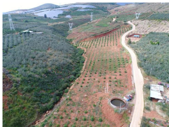
取土场现状 (栽植了果树)