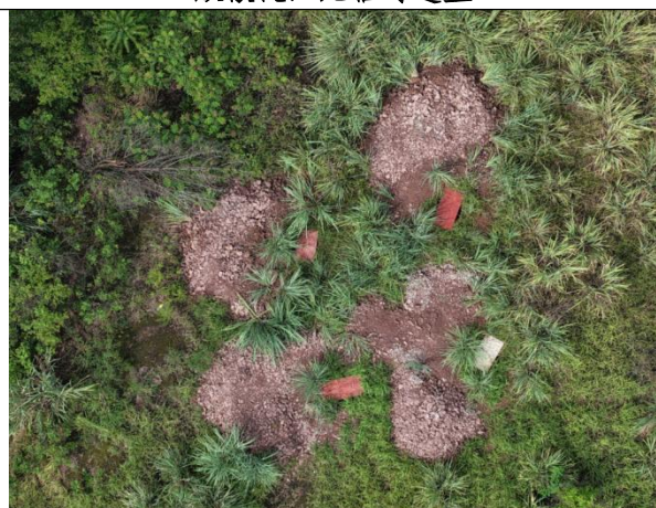
龙台~石板π入石羊N7未进行表土剥离,基础开挖土石堆放散乱,无临时遮盖