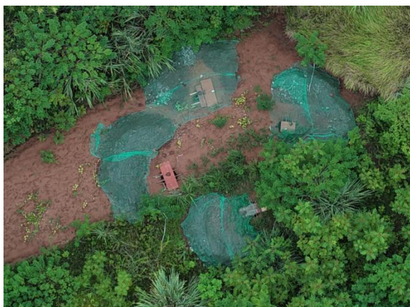
N53 表土剥离、临时遮盖