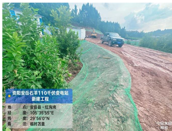
进站道路临时遮盖