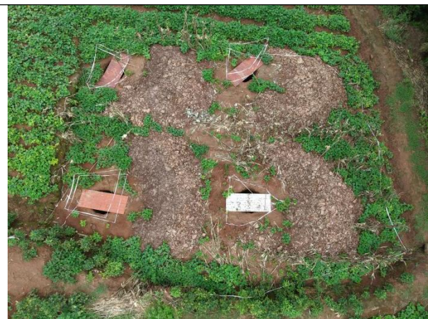
紫竹~石羊N35未进行表土剥离,基础开挖土石堆放散乱,无临时遮盖