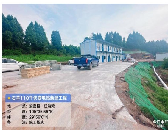
施工生产生活区临时遮盖