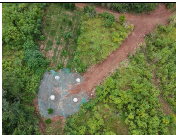
紫竹~石羊N15新修汽运道路无铺垫措施