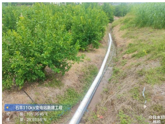
施工生产生活区临时排水管

石羊 110kV 变电站施工在站址东侧设现场办公生活场地。截止 2025 年 9 月，已采取了临时排水管、临时遮盖措施。本次现场监测情况如下：