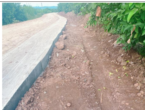
乡道拓宽施工后临时占地未及时恢复