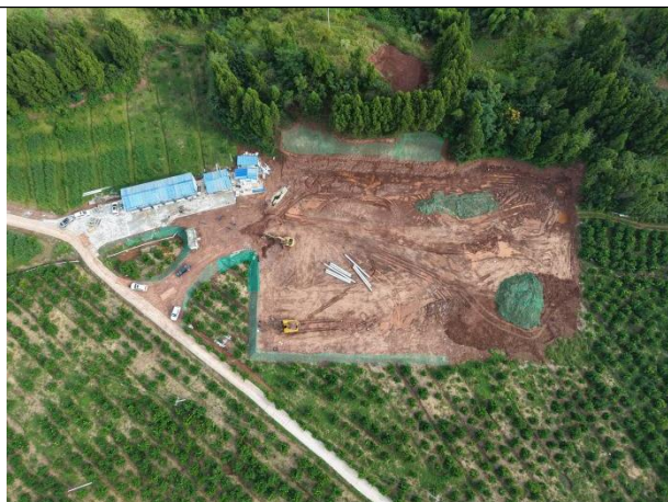
石羊变电站站内裸露地面、边坡等区域临时遮盖范围不足

根据现场监测，截止 2025 年 9 月，本工程水土流失主要区域为变电站主体工程区、塔基施工场地区、施工道路区，后续需及时加强表土剥离、遮盖与拦挡，施工后开展覆土、土地整治及植被恢复。现场监测典型问题如下：