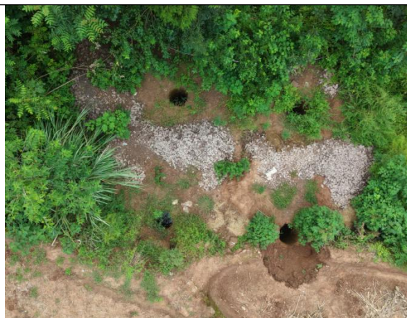
紫竹~石羊N73未进行表土剥离,无临时遮盖