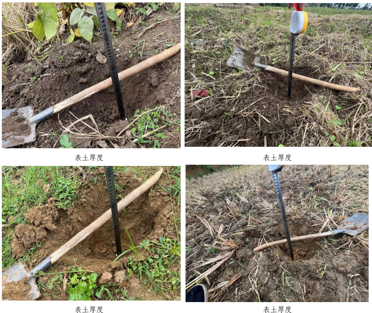
图 2.4-1 表土调查照片

本项目调查期间，调查人员根据项目区土地利用类型、立地条件在线路沿线典型位置设置了多个表土调查点，根据调查分析结果，射洪市林地地表土剥离厚度约为0.15-0.2m，本项目涉及的林地面积为0.69hm 2 ，耕地地表土剥离厚度约为0.25-0.30m，本项目涉及的耕地面积为0.67hm 2 ，本项目占地总的表土资源量约为0.32万m 3 。