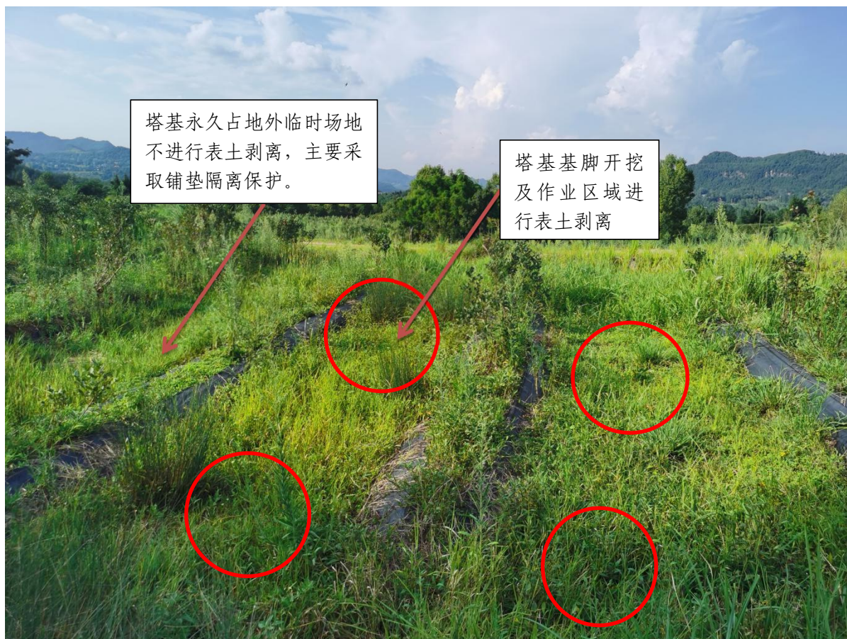
塔基表土剥离规划示意

案拟对施工扰动较轻的区域以及不涉及土石方开挖扰动的区域(包括塔基永久占地外临时场地、不存在土石方开挖扰动的牵张场、导线拆除临时堆放等临时占地区域)表土按少扰动、少破坏的原则不进行剥离。对塔基永久占用的区域表土进行剥离,施工结束后剥离表土用于迹地恢复区域表土回覆,用于恢复植被或恢复土地生产力,可保护土壤资源、使土地可持续利用。