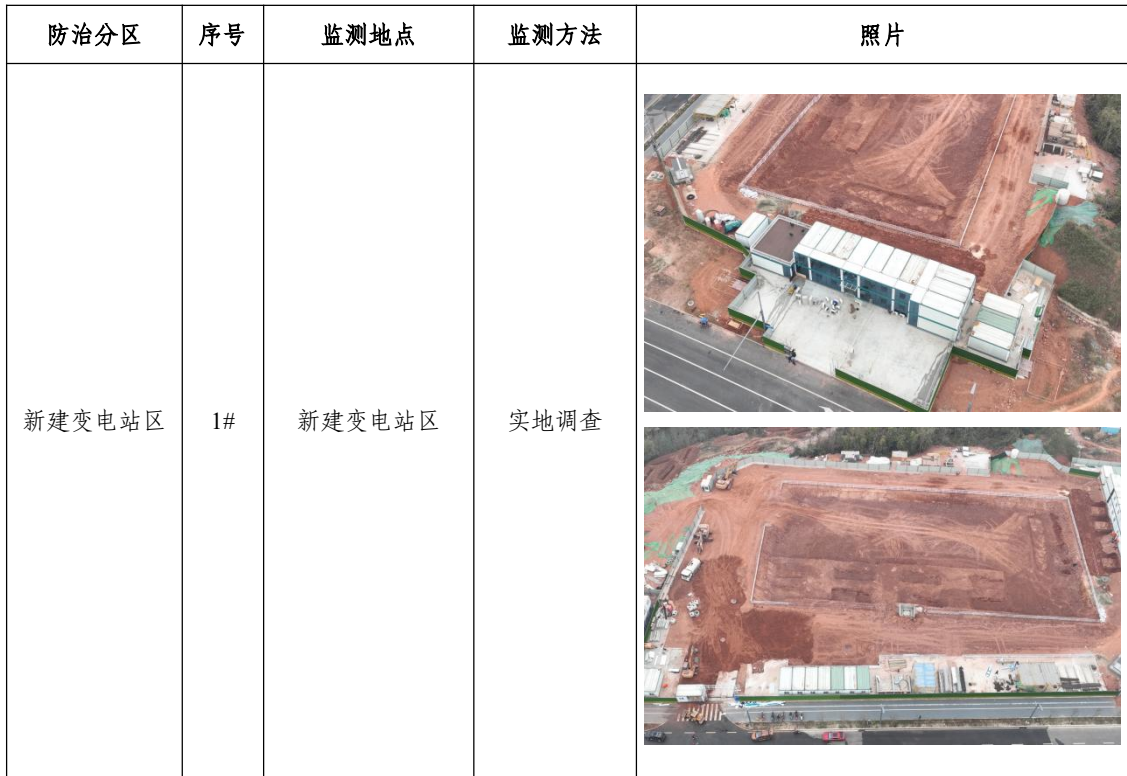
表 1.2-2 本季度水土保持监测点统计表